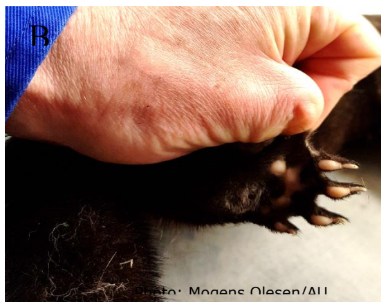
Figur 1. Exempel på baktassar från A. Flodutter och B. Farmad mink.

Minkar lever också på annat sätt än floduttern. Minkar jagar främst på/från marken, och kan också utföra korta dykningar, mestadels kortare än 10 s (Dunstone, 1993), för att jaga föda i vatten. Deras sinnen under vatten, pälskydd och simförmåga, är dåliga jämfört med en undervattensjägare som uttern (Wise et al. , 1981).