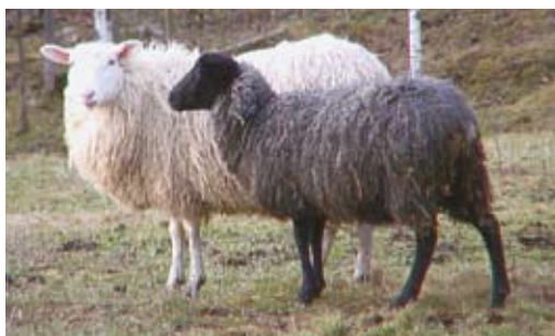
Får-INGÅ ÅNGSTEG

i ett område med ordinär täthet av fårbesättningar, i vilket det tidigare funnits lodjur utan att motsvarande problem uppstått. I det beskrivna fallet får en åtgärd i syfte att förebygga flera angrepp störst effekt om den riktas direkt mot den skadegörande individen. Denna problematik är dock ovanlig. I Sverige konstateras förekomsten av en problemindivid av lodjur ungefär vartannat år, trots att det finns ca 1 500 lodjur i landet.