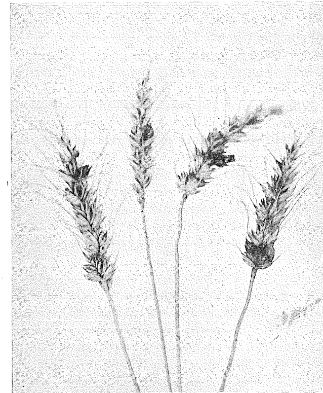
Mjöldrygor på Pikavehna-vete.

Beträffande mjöldryga på vete har angivits, att den var allmän i North Dakota (U. S. A.) 1921 och i den franska provinsen Ain 1922. Senare har den rapporterats från andra delar av U. S. A., från Kanada och England. I alla dessa fall omtalas angreppen som huvudsakligen förekommande på vissa bestämda vete-sorter.