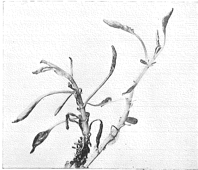
Viola cornuta angripen av Eriophyes violae .

åren. Bekämpningen försvåras också i hög grad av att djuren väl skyddas av galler eller bladintrångar. Anstalten vill tillsvidare föreslå besprutning med 2 % oljeemulsion eller upprepade svavelbepudringar. Huruvida dessa åtgärder äro fullt effektiva kan givetvis icke garanteras. Det kan i detta sammanhang vara lämpligt att framhålla hur betydelsefullt det är att resultaten av en företagen bekämpning meddelas anstalten, icke minst i sådana fall, då den önskade effekten av en eller annan anledning uteblivit.