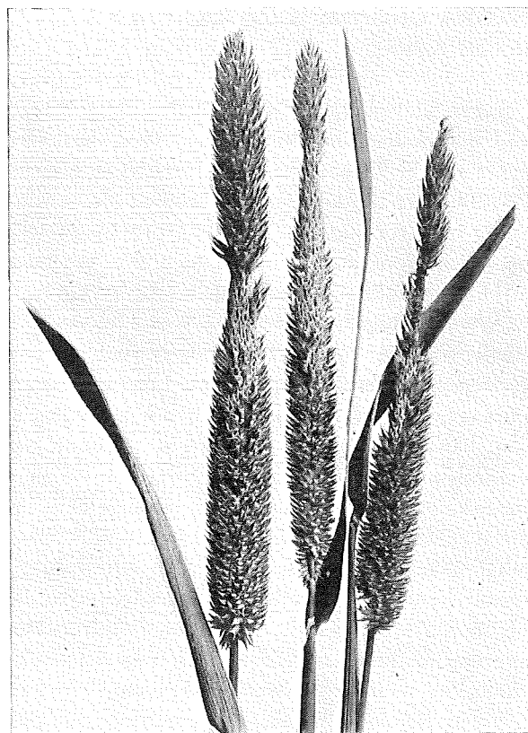
Timotejax angripna av timotejflugans larver.