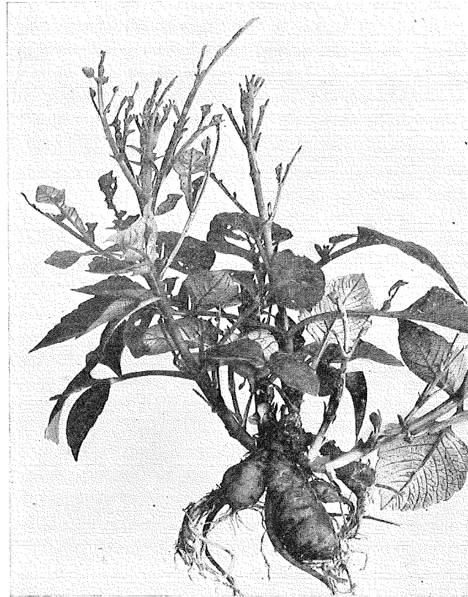
Bild. 1. Dahlia, svårt skadad av tvestjärtar.

krypa ned i. Djuren syntes sålunda ha föredragit sådana plantor, vilkas käppar erbjödo dem goda möjligheter att vid dagens inbrott gömma sig.