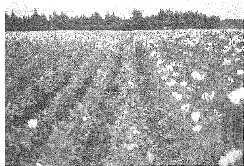
Fig. 1. Några rader med starkt angripna plantor, som ej ens gått i blom, knopparna ha vissnat på tidigt stadium. Närmast på båda sidor synas rader, där plantorna visserligen gått i blom men huvudsakligen bära skadade kapslar.

Några svårare sjukdomsangrepp hos vallmo ha förut ej inrapporterats till Växtskyddsanstalten, men i mitten på juli inkom prov av sjuka plantor från en av de större odlingarna i Västergötland, och vid besök på platsen gjordes en del iakttagelser, för vilka här i korthet skall redogöras. Med säkerhet kan ännu ej sägas, vilken sjukdom det är fråga om, men symtomerna överensstämna med en sjukdom, som tidigare förekommit i Bulgarien och beskrivits av CHRISTOFF såsom förorsakad av en svamp, Pleospora calvescens TUL. Om det enbart är denna sjukdom, eller om även bakterios förekommer, är ännu ej klarlagt.