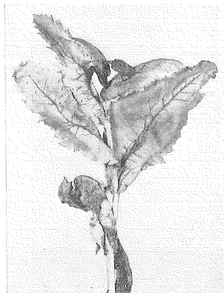
Fig. 2. Toppen av en planta, som angripits på tämligen tidigt stadium. Utom att de nedersta bladen äro helt vissna, ha de övre bladen bleknat och nerverna fått en mörk färg, som ej förekommer i normala fall. Blomknoppen har tillika med blomskäftet dött.