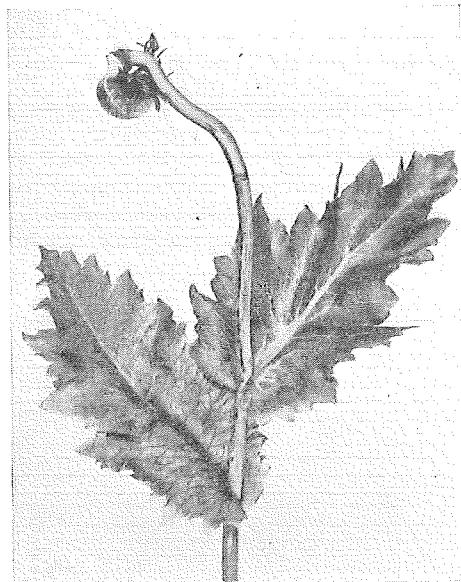
Fig. 3. Skada på något senare stadium, på stjälk och blomskäft finns en del mörkare fläckar och kapseln har förstörts redan under blomningen. Bladen se ännu i sin övre del friska ut, men i den basala delen ha de bleknat och nerverna börja där att framträda genom sin mörka färg.