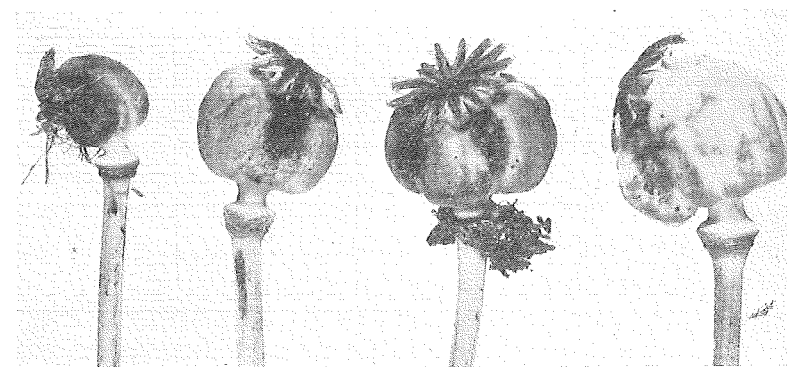
Fig. 4. Skadade kapslar i olika utvecklingsstadier.

För årets odlingar bör iakttagas, att för utsädesändamål frö ej tages annat än från odlingar, som äro fria från sjukdomen, eller åtminstone från en del av angripen odling, där den ej förekommer. Vare sig bakterios eller Pleospora -sjuka föreligger, kan sjukdomen nämligen överföras med frö, och då naturligtvis delvis genom grobart frö från partiellt angripna kapslar.