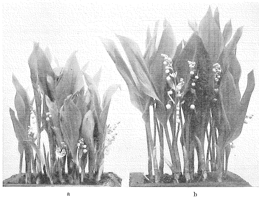
Fig. 1. Två konvaljelådor från ett försök, a) impregnerad med Fluralsil, b) obehandlad.

pregnerats med Fluralsil, ett tyskt träkonserveringsmedel. Ett flertal försök gjordes sedan vid växtskyddsanstalten för att närmare undersöka giftverkan av detta, som bestod av zinkkiselfluorid, ZnSiF_6 .