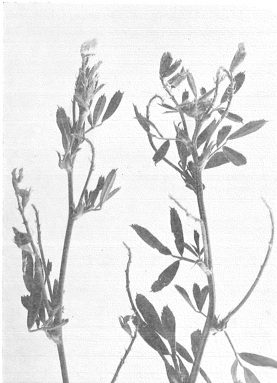
Skadade luzernplantor. De tomma blomställningsaxlarna och de förkrympta blomknopparna visa skadegörelsens art.