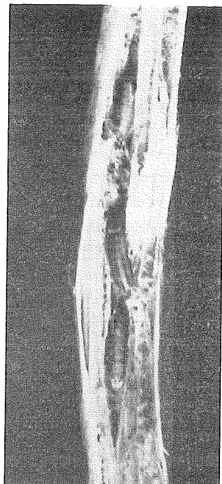
Sparrisstjälk med puppor av sparrisflugan. (Omk. 2 ggr först.)

har tidigare beskrivits. De kläckas redan efter några dagar och larven borrar sig in i sparrisstjälkarna. Då ända till ett 20-tal larver kan finnas i varje stjälk, kommer denna snart att genomborras av ett gångsystem, som kan sträcka sig åtminstone en halv meter upp (i de högre skotten) och ned till de underjordiska delarna. Främst i dessa sker sedan förpuppningen, och i de fall då det funnits många larver i stammen, komma pupporna att ligga ganska tätt. Som undantag kan en eller annan larv förpuppa sig i jorden alldeles intill roten. I Europa är blott en generation årligen iakttagen men i Amerika har man fastslagit två.