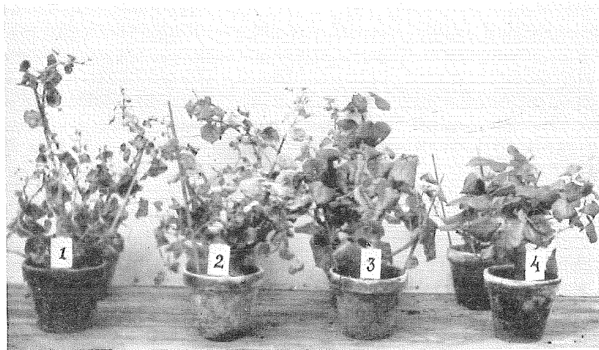
Fig. 1. Begoniaplantor från besprutningsförsök med mjöldagg. 1 obesprutad, 2 besprutad med F.D. Wettable Powder, 3 besprutad med anikol, 4 besprutad med F.D. White oil.

I den sista besprutningen följande dag medtogos endast led nr 2, 3, 4 och 5. Den 14 januari gjordes en sista kontroll och fotograferades några plantor från led 1, 2, 3 och 4 (Fig. 1). De med oljeemulsion besprutade begonierna voro nu fullkomligt fria från mjöldagg. På bladen funnos visserligen ännu kvar fläckar efter de tidigare angreppen, men svampbeläggningen på dessa var nu död. I detta sammanhang må eljest påpekas, att man ofta frestas att överskatta verkningarna av en oljebesprutning på grund av att bladen få ett så blankt och friskt utseende, att mjöldaggsfläckarna ej framträda så tydligt.