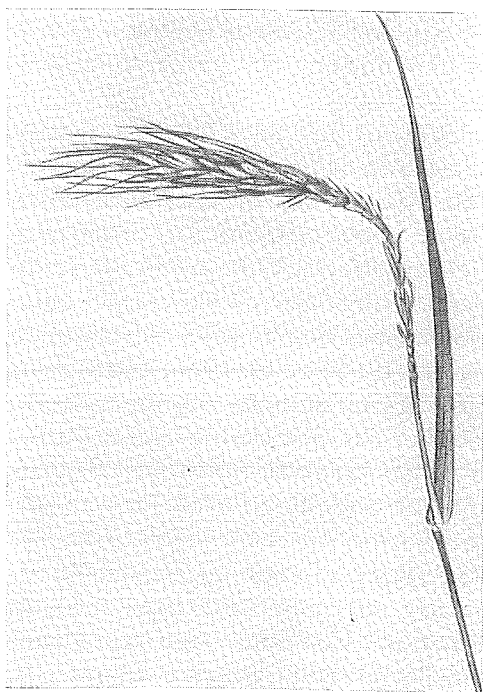
Rågax skadat av experimentellt framkallad frost (efter Sorauer).

I samband med väsentligt ökad användning av växtskyddsmedel och ogräsbekämpningsmedel såväl inom trädgårdsodlingen som inom jordbruket ha de nyttiga insekterna utsatts för en betydande förgiftningsrisk, som man på flera olika sätt försökt minska. Redan för åtskilliga år sedan utfärdades sålunda för användningen av arsenik vissa bestämmelser, vilka bl. a. avsågo att bereda visst skydd åt bin. Senare har ett flertal nya typer av bekämpningsmedel kommit i allmänt bruk av vilka några visat sig vara farliga för bin. I anslutning till verksamheten vid växtskyddsanstalten har emellertid den konfliktsituation, som uppstått genom att pollenöverförande insekter utsatts för skada eller risk att bli skadade, väl följts och beaktats. På initiativ av växtskyddsanstalten träffades sålunda redan för flera år sedan vissa frivilliga överenskommelser till skydd för bina och i samarbete med en av Kungl. Maj:t tillsatt utredning har studier bedrivits över hit-