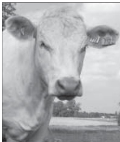
Charolaiskvigor betade på Götala sommaren 2001.