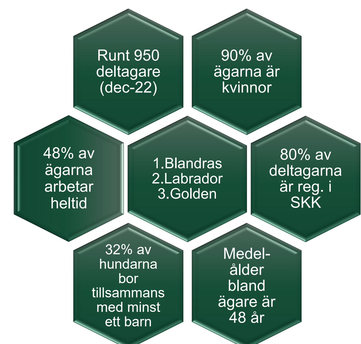
SNABBFAKTA: beskrivning av våra deltagare (dec-22)