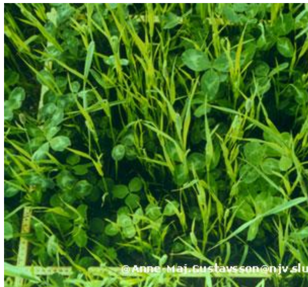
38 % klöver, 2900 kg/ha. Fotograferad från sidan.