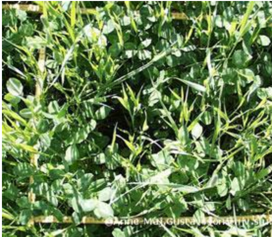
48 % klöver, 3200 kg/ha. Fotograferad rakt uppifrån.