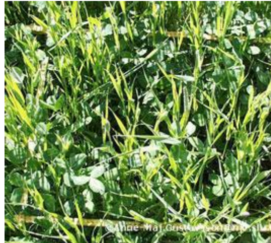
48 % klöver, 3200 kg/ha. Fotograferad från sidan.