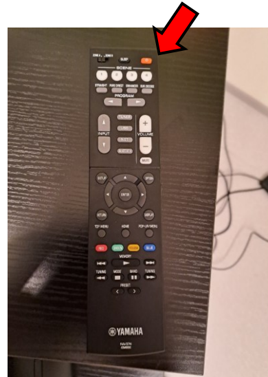
Kuva 2. Vahvistimen kaukosäädin

VR Domen äänet tulevat viiden kaiuttimen ja vahvistimen kautta. Kaiuttimet lähtevät päälle samalla kun käynnistät projektorit. Vahvistin käynnistetään mustan kaukosäätimen punaisella virta-napilla (katso Kuva 2).