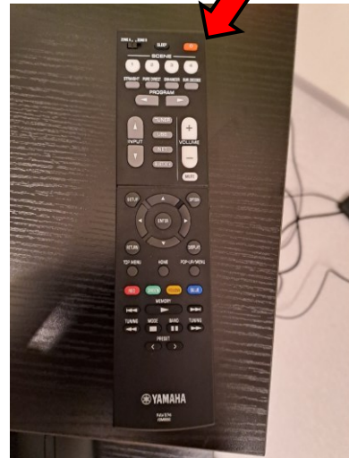
Kuva 6. Vahvistimen kaukosäädin

Kaiuttimet sammuvat samalla kun sammutat projektorit. Vahvistin sammutetaan mustan kaukosäätimen punaisella virtanappulalla (katso Kuva 6).