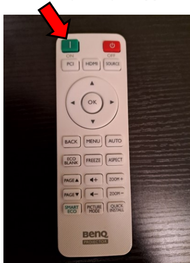
Kuva 1. Domen kaukosäädin

VR Domen kuva heijastetaan näytölle neljän projektorin avulla. Projektorit käynnistetään valkoisen kaukosäätimen ON-napilla (katso Kuva 1). Projektorit käynnistyvät hitaasti, joten odota hetki sen jälkeen kun olet painanut käynnistys nappia.