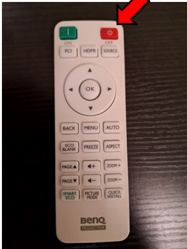
Kuva 5. Domen kaukosäädin

Dome tulisi sammuttaa, mikäli sille ei ole tulossa lähiaikoina käyttöä. Projektorit sammutetaan valkoisen kaukosäätimen OFF-napilla (katso Kuva 5). Nappia täytyy painaa kahdesti, jotta projektorit sammuvat.