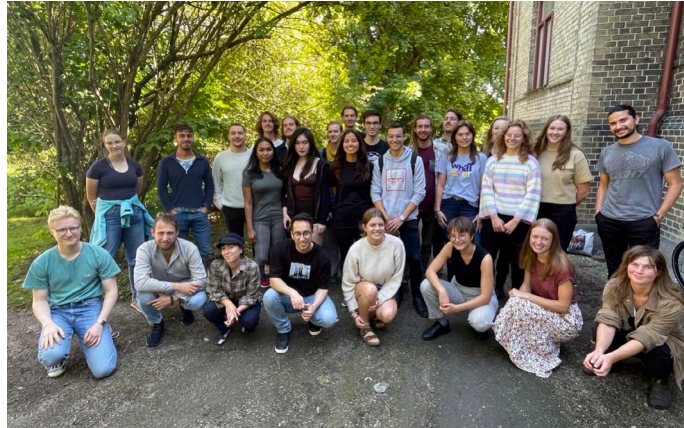
Terminsstart på det nya programmet Forest and Landscape.

– Inte minst är det en fin möjlighet för Skogsmästare och alla som läst Hållbart