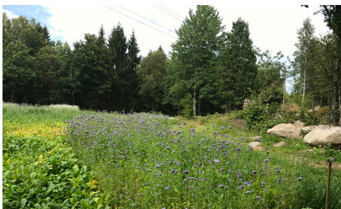
En viltåker i blom.

DELTAGANDE organisationer i ”Vild och bortskämd” är Länsstyrelsen Skåne, Skogsstyrelsen, Jägförbundet Skåne-Blekinge, Naturskyddsföreningen Skåne, Sveriges Lantbruksuniversitet, Jordägareförbundet, LRF, Högskolan Halmstad och privata markägare.