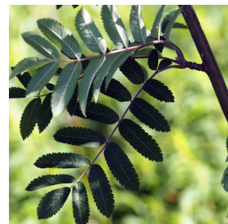
Rönn är något av en favorit för älgarna

– Med ganska små insatser kan man göra stor skillnad och det ska helst inte kännas pliktfullt, utan inspirerande.