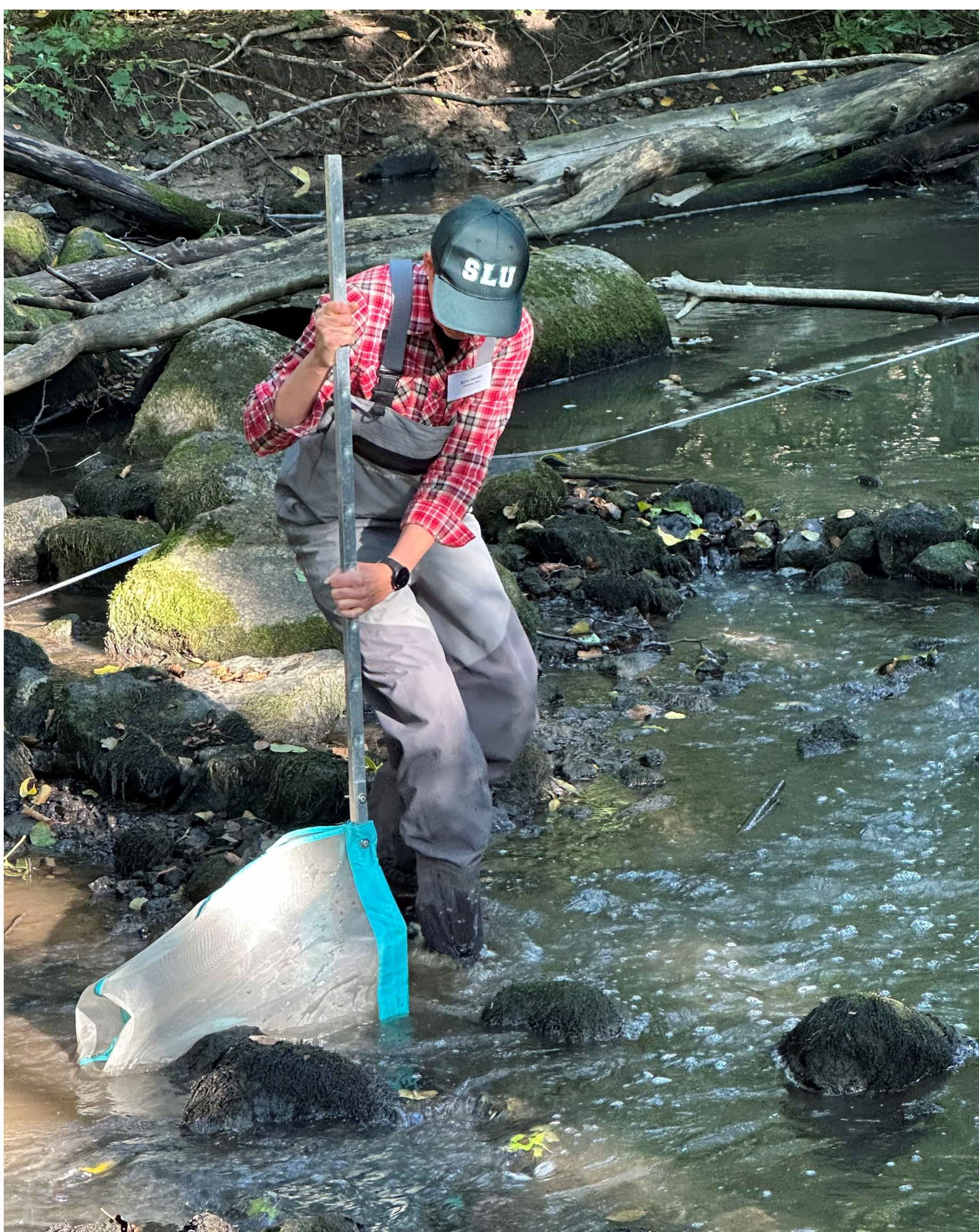
I utbildningen ingår provtagning av fastsittande kiselalger, växtplankton och bottenfauna i sjö och vattendrag.