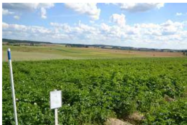
Vikmanshyttan 5 augusti 2011