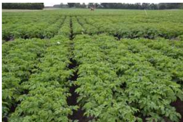
Hemse 2 august 2011