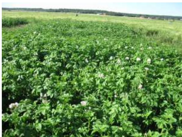
Umeå 17 augusti 2011