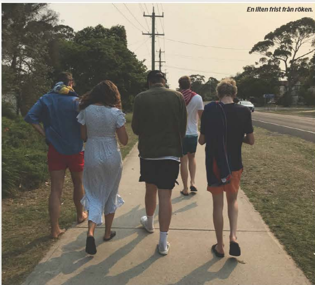
En liten frist från röken.