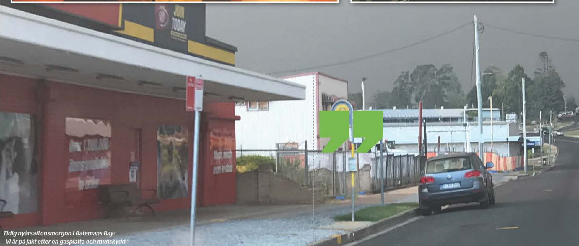
Tidig nyårsaftonsmorgon i Batemans Bay: Vi är på jakt efter en gasplatta och munskydd."