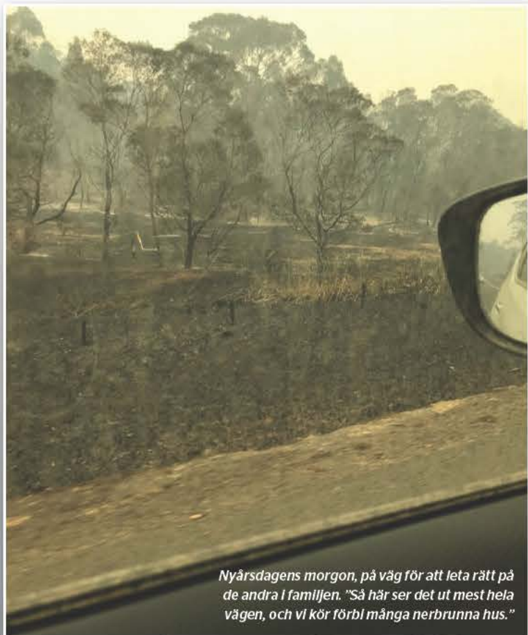
Nyårsdagens morgon, på väg för att leta rätt på de andra i familjen. "Så här ser det ut mest hela vägen, och vi kör förbi många nerbrunna hus."

Forskare i miljökommunikation på Sveriges lantbruksuniversitet (SLU)